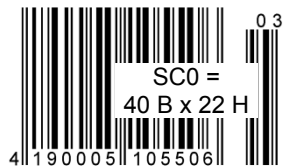
Abbildung ist keine Originalgröße.